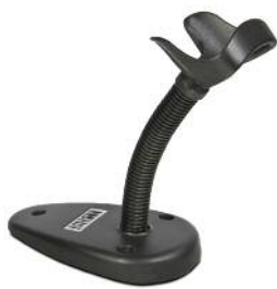
STD-QD20-BK: Stand mains-libres Permet d'utiliser le lecteur en mode mains-libres. Aussi disponible en blanc.