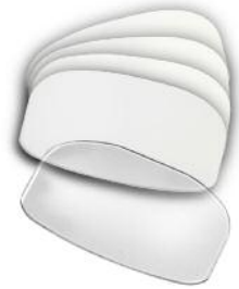
11-0319: Kit de 5 vitres de remplacement Permet à l'utilisateur de remplacer une vitre endommagée sans avoir à envoyer le scanner pour réparation.