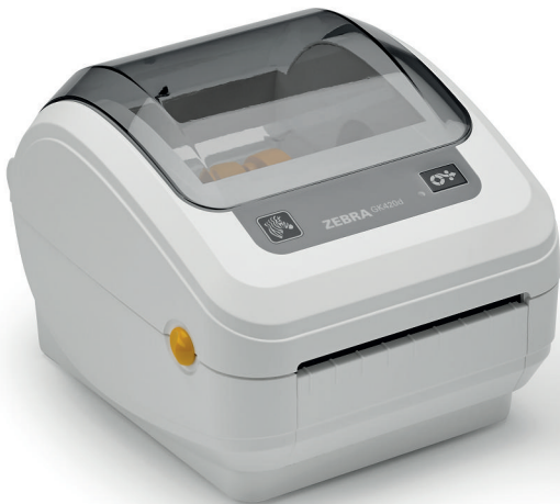
GK420d pour le secteur de la santé