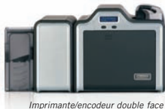
Imprimante/encodeur double face