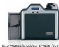
Imprimante/encodeur simple face