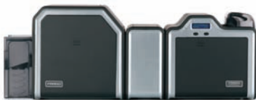
Option de laminage et imprimante/encodeur double face